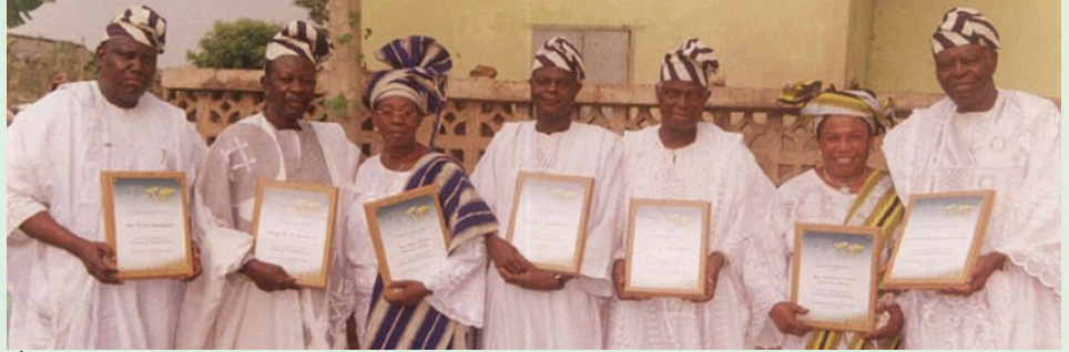
Àwọn egbe aráa CAG Yórùbá nrétí wípe iwádí-ìjínlẹ̀ tí iran ọ̀tọ̀tọ̀ má jẹ̀ kí àwọn èniyàn kákírí àgbà̀yè súnmọ̀ arawọ̀n.

Àwọn èniyàn tó sojúuse nínú idáwólé HapMap yí jẹ̀ àwọn tí idáwólé náà wun bótilẹ̀jẹ́pé wọn kó gbá àlà̀yè nípá isẹ̀ náà. Àwọn èsì tagbéláwùjọ̀ èdà tí idáwólé yí mù ọ̀rọ̀ wá làti àwọn mírán pèlú àsà̀rò nípá