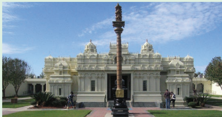
Tempelí tí Meenakshi ní Pearland, Texas jẹ́ ibi ipàdẹ̀ pàtàkì fun àwọn ọ̀mọ- egbè àgbèègbè aráa Gujaratí Índià ní ilu.