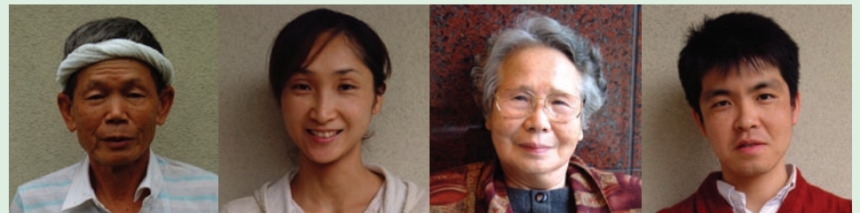
Ọ̀pọ̀lọ̀pọ̀ àwọn ọ̀lọ̀rẹ̀ ni orílẹ̀ èdèe Jèpáànù tí sojúùse tẹ̀lẹ̀tẹ̀lẹ̀ nínú àwọn ìdàwólé iwádí ijìnlẹ̀ nípa isoògùnonyè m̀iràn.

àwọn orílẹ̀ èdèe tó wa ní iwò ọ̀dùn àti báwo ni imójútó to péyè ma sé wa fun àwọn àpèjúwe nàà tí wọn ba tí tẹ́ àwọn ará ilé iwádí Coriell lojọ́. Ní ìdáhùn si diẹ́ nínú àwọn ibèèrè nàà, ilé iwádí Coriell yí diẹ́ nínú àwọn ilàna wọn pada làti gba àlàyè lèkùnrèrẹ̀ làti ọ̀wọ̀ àwọn awadí tó béèrè fun àwọn àpèjúwe nàà kí a lé kédèe pada fun àwọn egbè àmòyé ni agbègbè orílẹ̀ èdèe Jèpáànù (CAG)