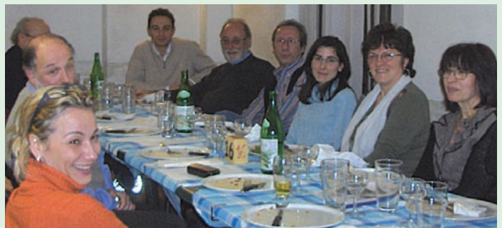
Àwọn ọ̀mọ̀-egbè CAG tí Tòskaní sé àsà̀rò nípá èsì idáwólé HapMap fun àgbèègbè wọn.

gbogbo àpótí àpèjúwe tí wọn fi ránsé sí àwọn àwádí làti àgbèègbè yí. Fun linkki sí gbogbo iwé ọ̀rọ̀ yí, ẹ̀ wó http://ccr.coriell.org/nhgri/tuscan.html .